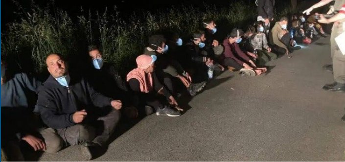
Selbst bei Nacht reißt der Strom illegaler Einwanderer nicht ab. Hier im burgenländischen Lutzmannsburg.